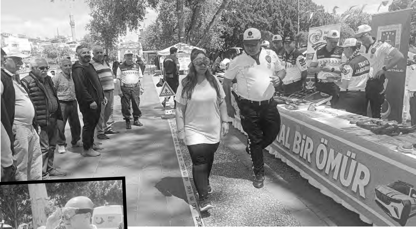
Alkol Simülasyon Gözlüğü gördü.

2-8 Mayıs Trafik Haftası kapsamında Manavgat Cumhuriyet Meydanı'nda etkinlik düzenlendi. Trafikle ilgili afiş ve dövizlerin yer aldığı standı gezen vatandaşlara çeşitli hediyeler verildi. Ayrıca trafik kurallarına uyan ve örnek davranış sergileyen 3 araç sürücüsüne plaket verildi. Örnek sürücü olarak plaket alan sürücüler, araç kullananları kurallara uymaya davet ederken, böylelikle kazaların önüne geçilebileceğini belirttiler. Farkındalık oluşturularak vatandaşların trafik kurallarına uymaları amacıyla gerçekleştirilen etkinlikte en büyük ilgiyi