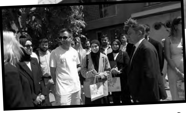
ÖĞRENCİLER, DESTEKLER İÇİN TEŞEKKÜR ETTİ