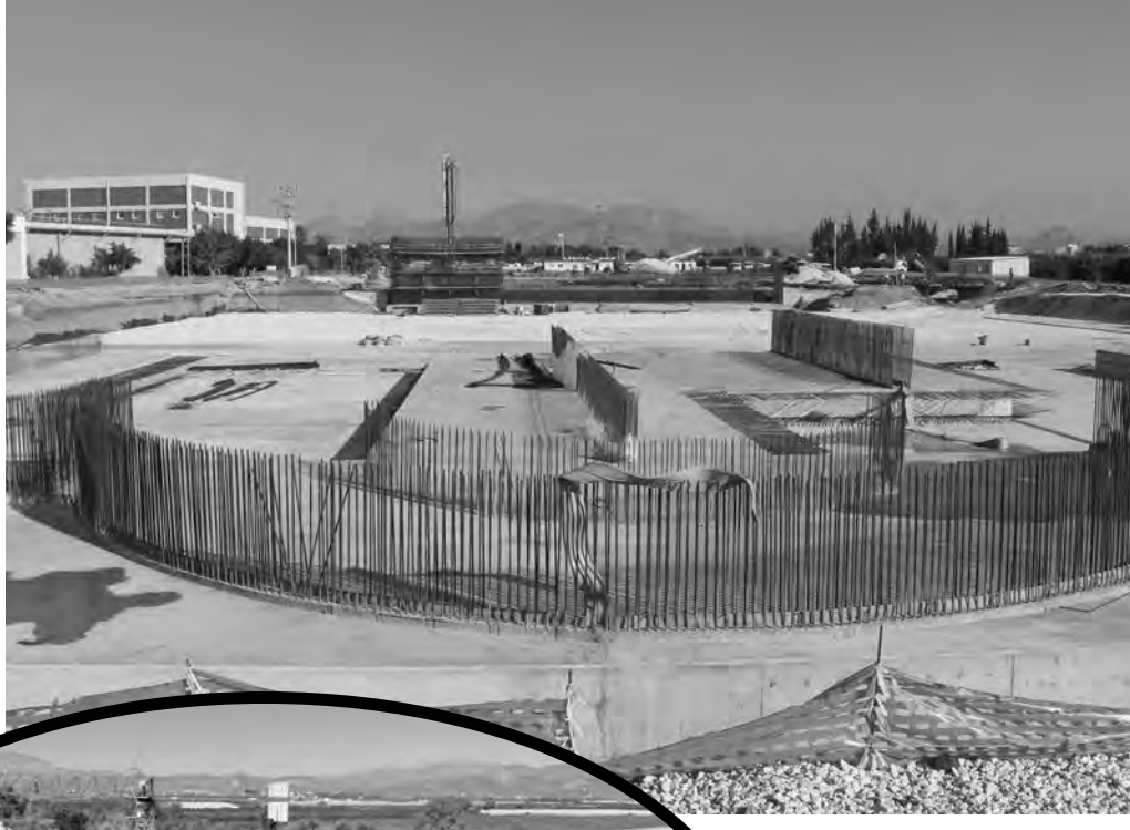
434 bin TL'lik yatırım gerçekleştirildi.

ASAT'ın Serik'e yönelik en büyük yatırımı ise 2 milyar 118 milyon TL ile atıksu arıtma projelerine yapıldı. Modern arıtma sistemleri sayesinde çevresel sürdürülebilirlik ve halk