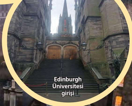
Edinburgh Üniversitesi girişi