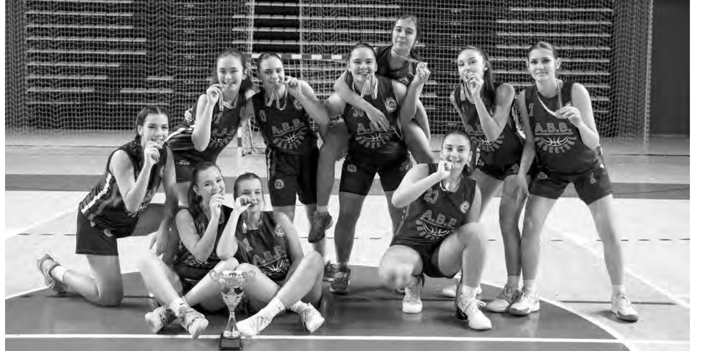
Şampiyonu olan Antalya Büyükşehir Belediyesi Spor Kulübü Kız Basketbol B Takımı, Antalya'yı Türkiye Yarı Finalle-

ANTALYA'YI sporla buluşturan, 7'den 70'e birçok dalda amatör ve profesyonel sporculara destek sağlayan Antalya Büyükşehir Belediyesi'nin U16 Kız Basketbol A ve B Takımları, Antalya Basketbol Yerel U16 Ligi'nde finale yükseldi. Rekabetin yanı sıra dostluk içerisinde geçen final müsabakasını kazanan Büyükşehir Kız Basketbol B Takımı şampiyon oldu. Her iki takımın da kupaya uzanmak için büyük efor sarf ettiği mücadele 62-49'luk skorla tamamlandı. Antalya Spor Salonu'nda oynanan mücadelede, sporcuların aileleri ve basketbol severler basketbolculara tribünden destek verdi. Çocuklarının başarılarına tanık olan ailelerin mutlulukları gözlerinden okundu. İkinci olan A Takımı ve şampiyonluk kupasını kazanan B takımının genç sporcuları, başarılarını doyusya kutladı. Antalya Büyükşehir Belediyesi'nin desteğiyle parlayan genç yıldızlar ayakta alkışlandı.