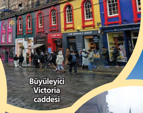
Büyüleyici Victoria caddesi