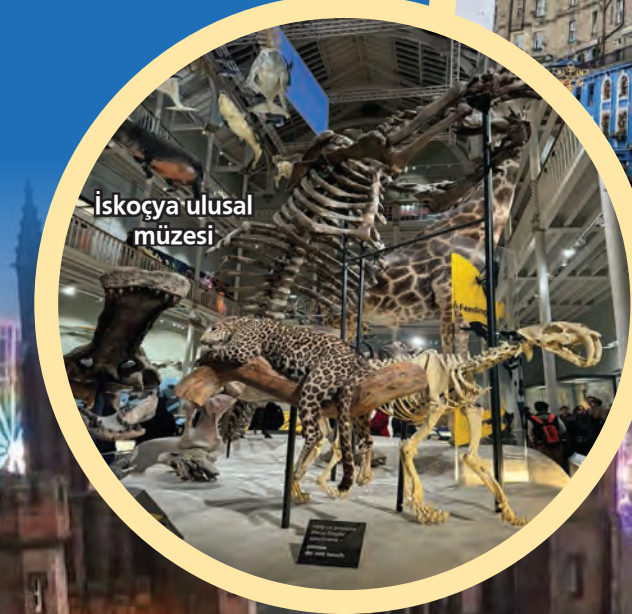
İskoçya ulusal müzesi