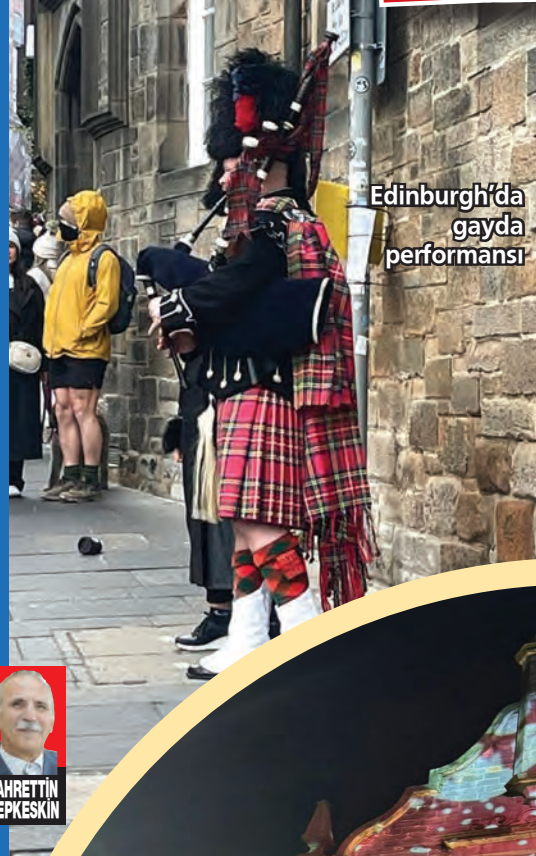
Edinburgh'da gayda performansı

Christmas günleri olduğu için kalabalık ve bir o kadar da hareketli bir şehir Edinburgh. 'Mutluluk bulaşıcıdır' dedikleri bu olsa gerek. Bize de şehrin enerjisi geçti diyebilirim. Victoria Street, gerçekten de rengarenk dükkanlarıyla tam bir 'büyücü' alışveriş caddesi