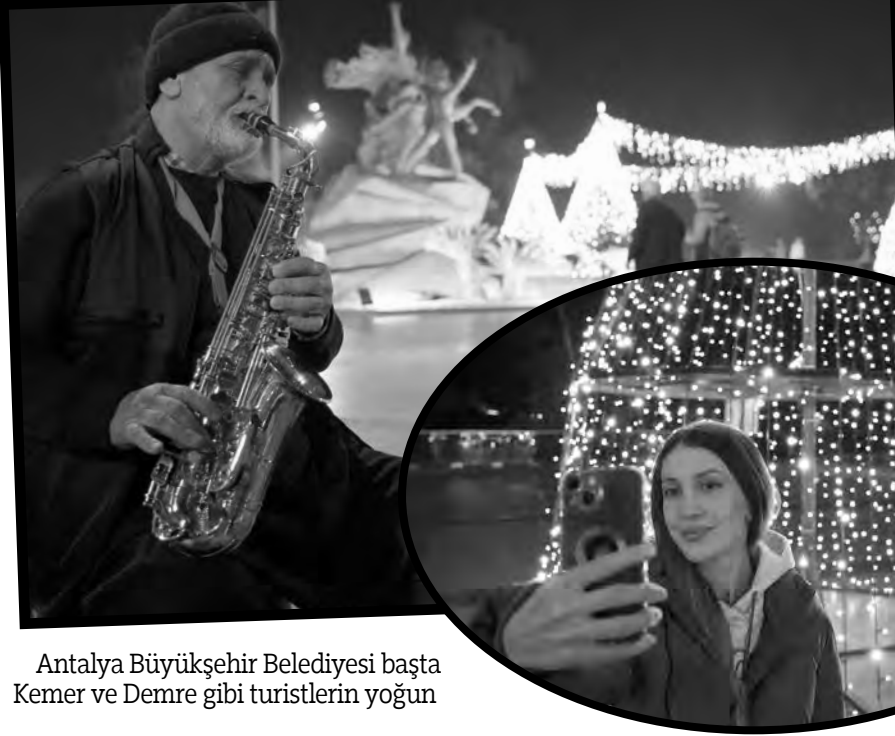
Antalya Büyükşehir Belediyesi başta Kemer ve Demre gibi turistlerin yoğun

Park ve Bahçeler Dairesi Başkanlığı ekipleri kent merkezinde Cumhuriyet Meydanı, Karaalioglu Parkı, Saat Kulesi, Cam Piramit, Atatürk Kültür Merkezi ve bulvarlarda ışıklandırma çalışması gerçekleştirdi. Yapılan süsleme ve ışıklandırmalar görsel şölen oluşturuyor. Süslemeleri görenleri am ölümsüzleştirmek için süsleme ve ışıklandırmaların önünde bol bol hatıra fotoğrafı çekiyor.