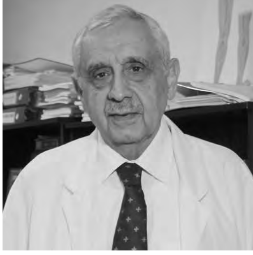
Akdeniz Üniversitesi Hastanesi'nde, Türkiye'nin ilk yüz ile çift kol nakli ve dünyanın ilk kadavradan rahim nakli yapıldı. Nakil bekleyen hastalar arasında kalp nakli için sı-

Nakillerin gerçekleştirildiği merkezlerden