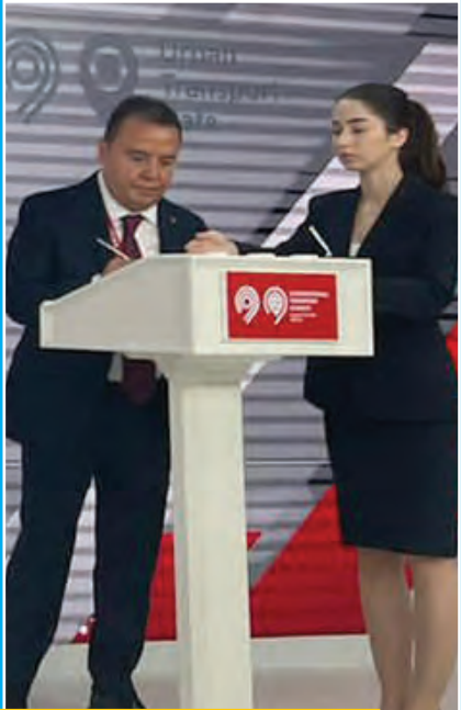
Başkan Muhittin Böcek aynı zamanda Ulaşım, Turizm ve Dijitalleşme alanlarını içeren işbirliği protokolünü de imzaladı.

Moskova Uluslararası Ulaşım Zirvesi'ne konuşmacı olarak katılan Başkan Böcek "Dünya ülkeleri ile hangi projeleri uygulayabileceğimizi paylaşma ve daha iyi nasıl geliştirebileceğimiz gibi konuları görüşme fırsatı bulduk" dedi