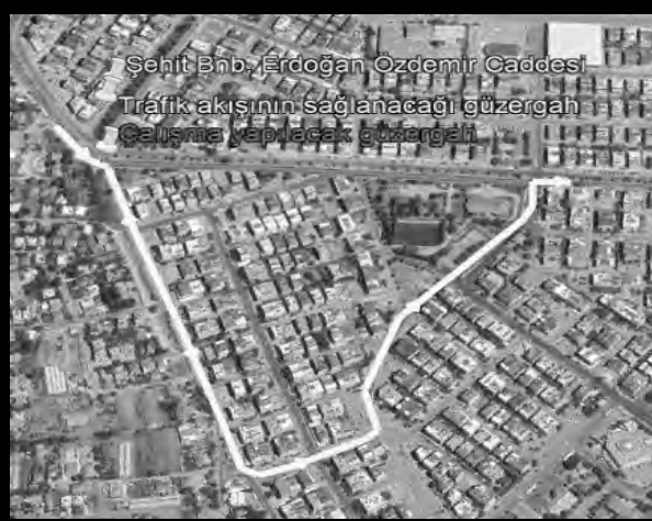
Şehit Binbaşı Erdoğan Özdemir Caddesi Trafik akışının sağlanacağı güzergah Çalışma yapılacak güzergah

BÜYÜKŞEHİR Belediyesi ASAT Genel Müdürlüğü kent merkezinde yağmur suyu drenaj çalışmalarını sürdürüyor. Bu kapsamda Kepez İlçesi, Şehit Binbaşı Erdoğan Özdemir Caddesi'nde yağmur suyu çalışması bugün itibarıyla yol 30 gün süreyle trafiğe kapatılacak. Antalya Büyükşehir Belediyesi ASAT Genel Müdürlüğü bugün itibarıyla Kepez İlçesi Şehit Binbaşı Erdoğan Özdemir Caddesi'nde yağmur suyu altyapı drenaj çalışmasına başlayacak. Bu nedenle Şehit Binbaşı Erdoğan Özdemir Caddesi 30 gün süreyle trafiğe kapatılacak. Şehit Binbaşı Erdoğan Özdemir Caddesi'nden, 75. Yıl Caddesi istikametine gidecek olan sürücü ve vatandaşların trafikte sorun yaşamaması için 30 gün süreyle alternatif olarak 3734 Sokak güzergahını kullanmaları istendi. HABER MERKEZİ