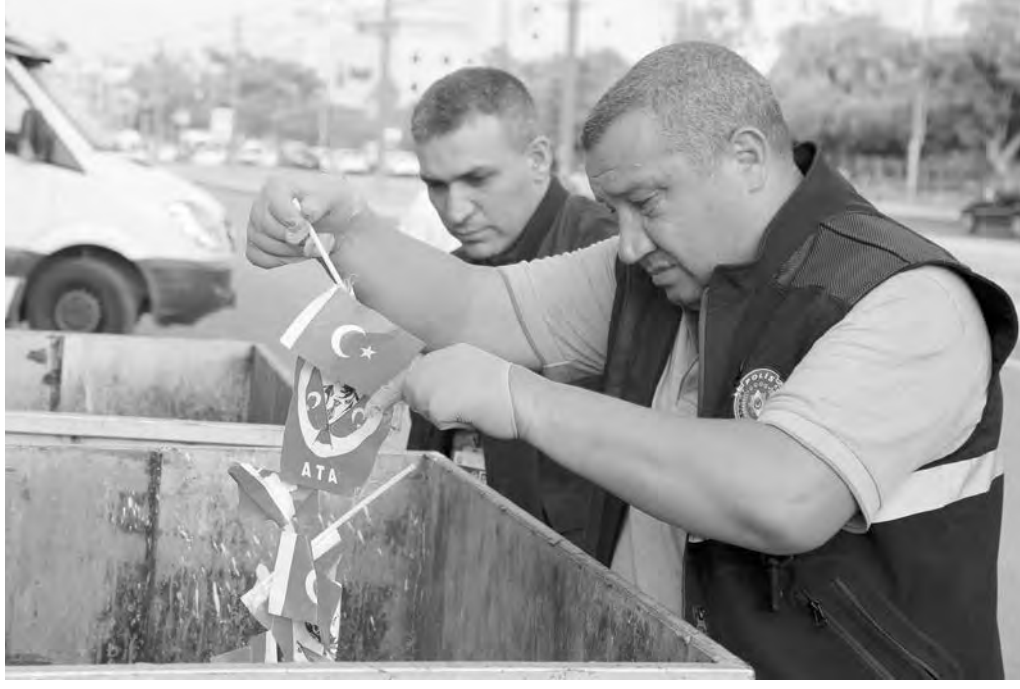
gelmesi ile polis ekipleri, Türk bayraklarının okuldan atılıp atılmadığının tespit edilmesi amacıyla güvenlik kameralarını inceleme-ye aldı.

Ekipler, çöp konteynerinin cadde üzerinde bulunan bir okulun önünde bulunması nedeniyle okul yetkililerine ulaşmaya çalıştı. Bu sırada Antalya İl Emniyet Müdürlüğü Olay Yeri İnceleme Şube Müdürlüğü ekipleri, çöp konteynerinde bulunan Türk bayraklarını teker teker itina ile delil torbasına koydu. Bir süre sonra okul yetkilisinin olay yerine