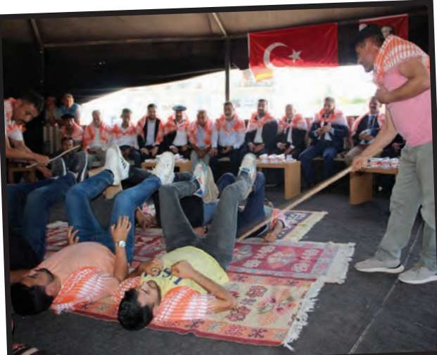
Mahalle gençleri tarafından geçmişte yörede oynanan ve unutulmaya yüz tutmuş orta oyunları sergilendi.